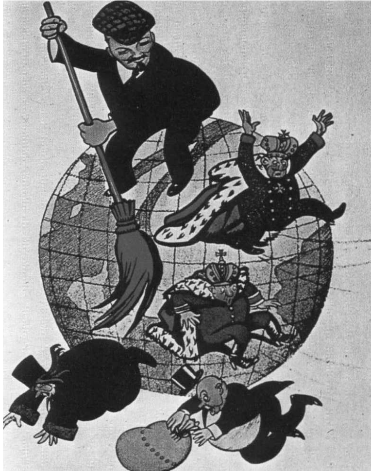
Ρώσικη γελοιογραφία του 1917

– Να εξηγήσετε τον συμβολισμό της γελοιογραφίας: