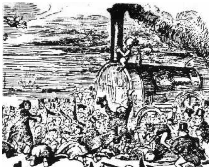
Γελοιογραφία: Επενδυτική Υστερία στην δεκαετία του 1840 (Punch)

Αφού μελετήσετε τα παραθέματα και λάβετε υπόψη τις σχετικές πληροφορίες του σχολικού βιβλίου, να σχολιάσετε τη φράση του βιβλίου σας: «... Ο σιδηρόδρομος έγινε το σύμβολο των νέων καιρών... και το συνώνυμο της ανάπτυξης στον 19ο αιώνα».