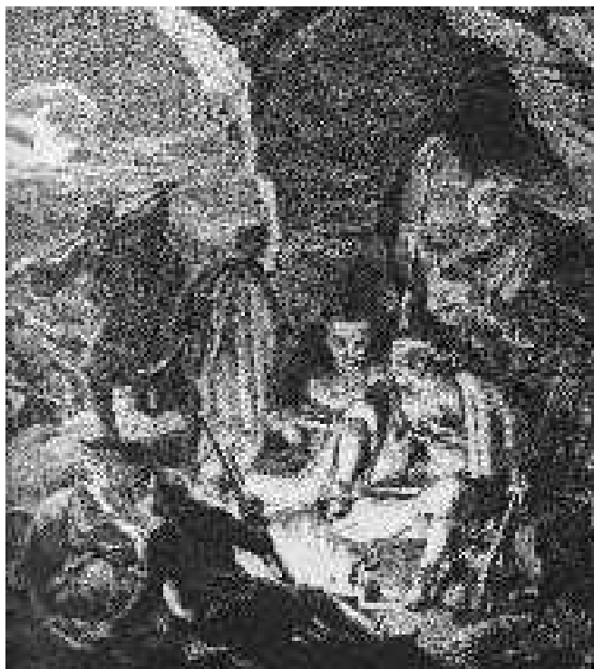
Σκηνή πειρατικής ζωής εις τας νήσους του Αιγαίου, κατά πίνακα του Βαρώνου Von Stackelberg. Αι ελληνικάί νήσοι και αι ακταί προσεφέροντο δια την πειρατείαν, το δε