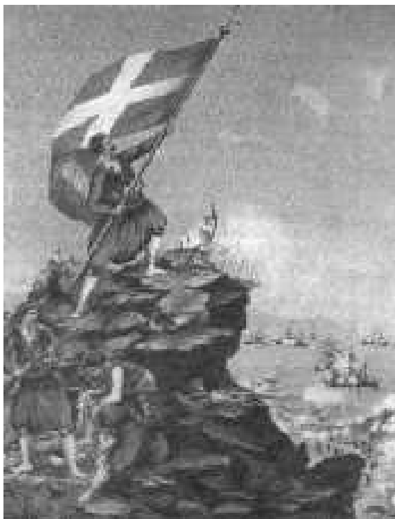
Εικόνα σχολικού βιβλίου, σ. 175

Το ελληνικό στρατόπεδο του Ακρωτηρίου, κατά το βομβαρδισμό του από τις Μ. Δυνάμεις και τους Τούρκους, το Φεβρουάριο του 1897