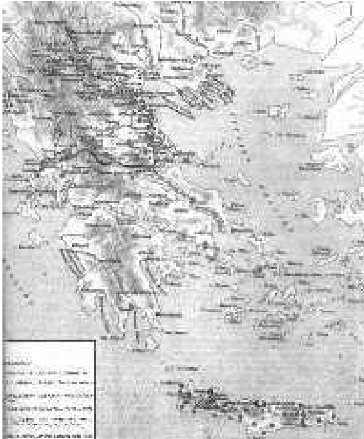
Χάρτης του σχολικού βιβλίου, σ. 197

Οι επαναστάσεις του 1878 στη Θεσσαλία, Ήπειρο, Μακεδονία, Κρήτη