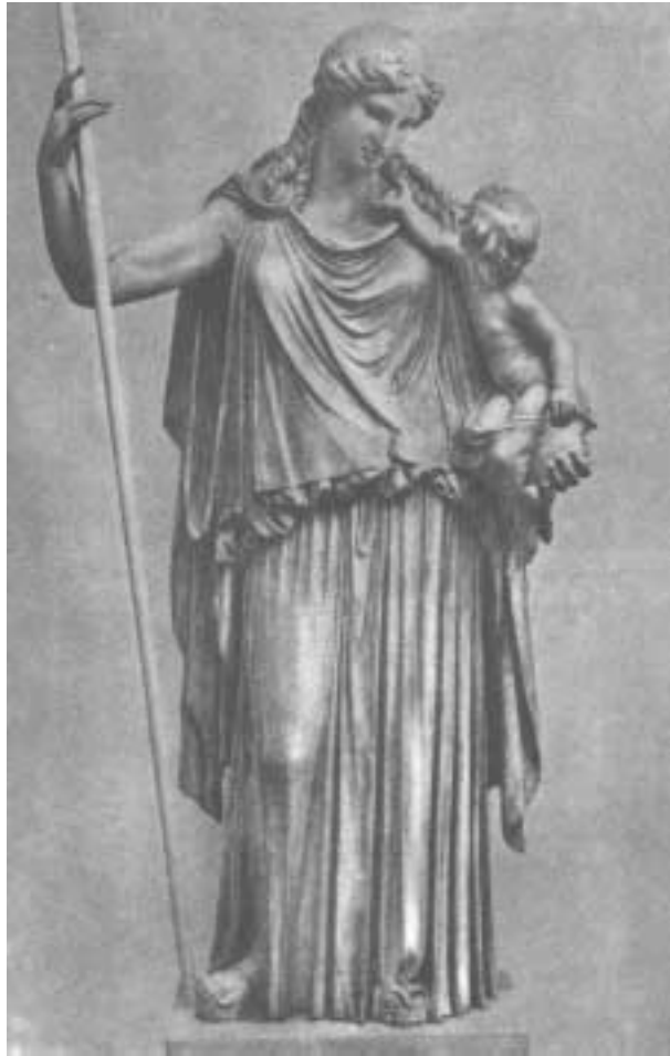
Η Ειρήνη του Κηφισόδοτου. Ρωμαϊκό αντίγραφο στο Μουσείο του Μονάχου