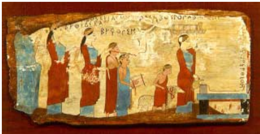
Εύλιος αναθηματικός πίνακας με παράσταση πομπής λατρευτών (540 π.Χ.)