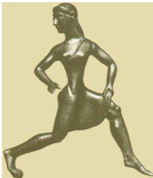
Σπαρτιάτισσα. Χάλκινο του 500 π.Χ.