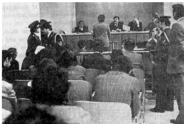
Ελληνικό Δικαστήριο σε ώρα συνεδρίασης