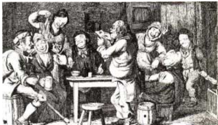
Μια φιλική συγκέντρωση σε ένα λαϊκό σπίτι