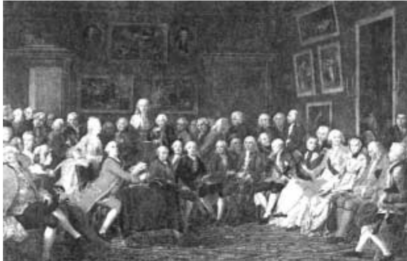
Φιλολογική συγκέντρωση σε αστικό σαλόνι