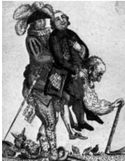
Οι τρεις κοινωνικές τάξεις στη Γαλλία πριν από το 1789. Γαλλική γελοιογραφία του 18 ου αιώνα.

Ο καλλιτέχνης σ' αυτήν την γκραβούρα, αποδίδοντας μ' έναν ξεχωριστό τρόπο τις σχέσεις μεταξύ των κοινωνικών τάξεων, γελοιογραφεί τη φεουδαρχική τάξη πραγμάτων.