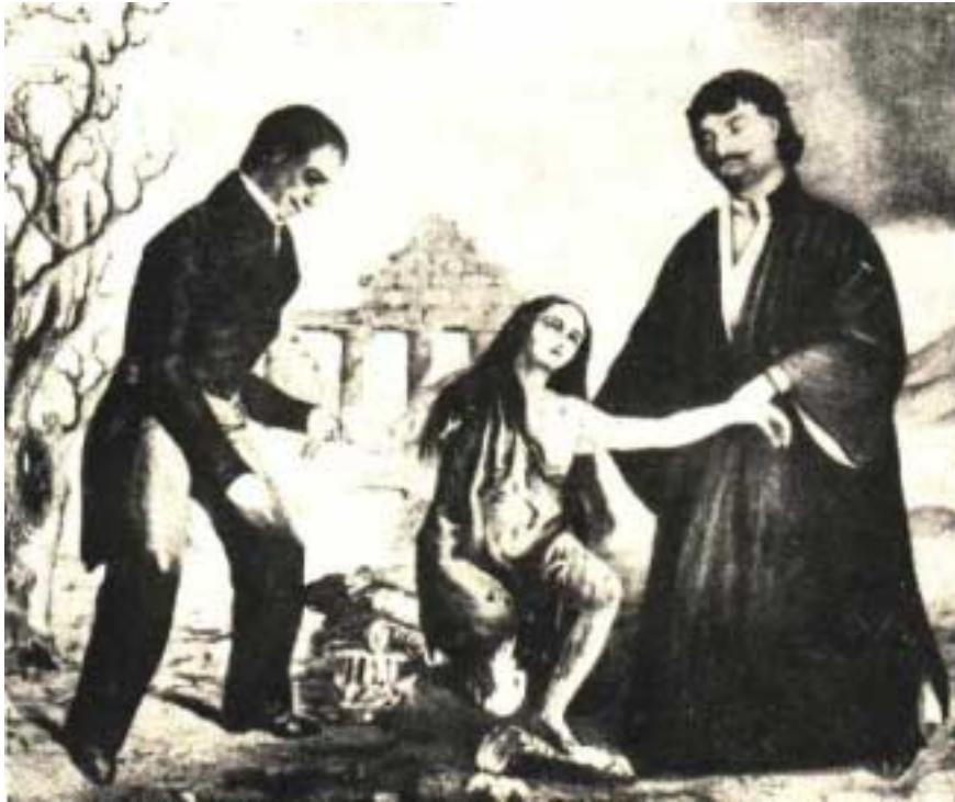
Αλληγορική παράσταση σε παλιά λιθογραφία

«Στα πρώτα χρόνια έπειτα απ' την απελευθέρωση του τόπου απ' τον τουρκικό ζυγό στα καφενεία και στα σπίτια, στις πολιτείες και στα χωριά, έβλεπες κρεμασμένη αυτή τη λιθογραφία».