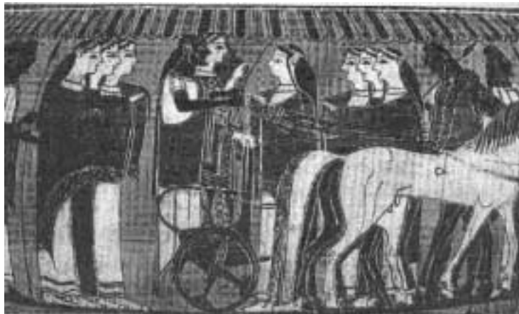
Το αγγείο βρίσκεται στο Μουσείο του Βατικανού

Εικονίζεται η στιγμή που η νύφη οδηγείται στο σπίτι του γαμπρού. Διακρίνονται οι νεόνυμφοι πάνω σε άμαξα που τη σέρνουν τέσσερα άλογα. Ο γαμπρός γενειοφόρος κρατάει τα ηνία της άμαξας, ενώ η νύφη ανασηκώνει το πέπλο της. Το ζευγάρι συνοδεύουν στο νέο σπίτι τους συντροφιές ανδρών και γυναικών.