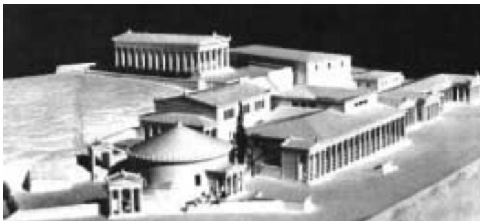
Η Δυτική πλευρά. Άποψη από τα Νοτιοανατολικά, 2ος αι. μ.Χ. Μακέτα.